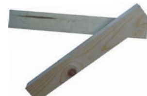
当木 30×40 高さ900までは2本 高さ1000からは4本