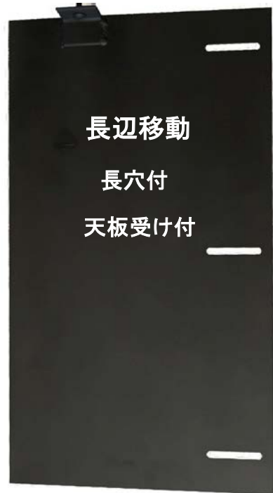
長辺移動 長穴付 天板受け付