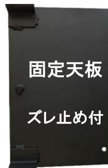
固定天板 ズレ止め付