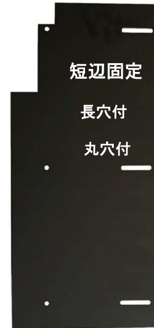
短辺固定 長穴付 丸穴付