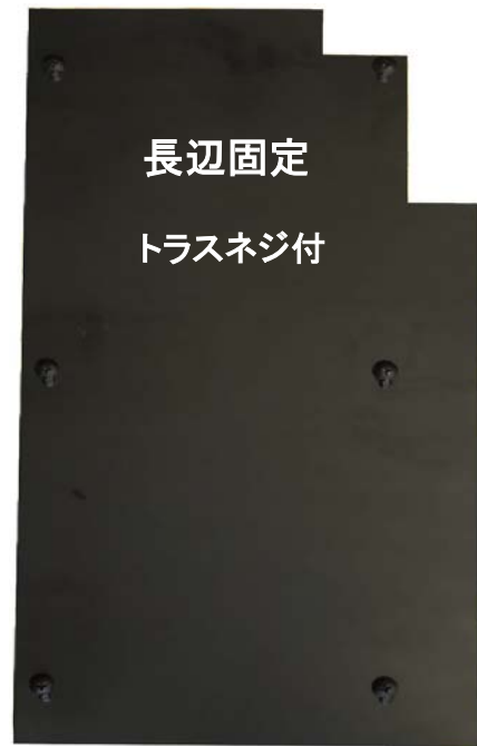
長辺固定 トラスネジ付