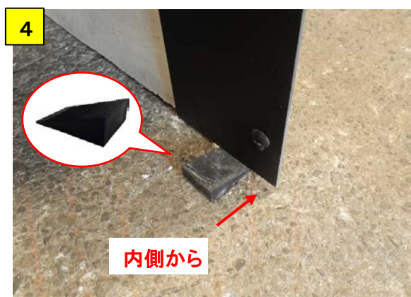
A固定・B固定の高さをクサビで調整する 注)クサビは全て内側から差し込む