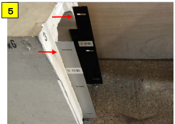
側溝とA固定・B固定に隙間が無いように注意する