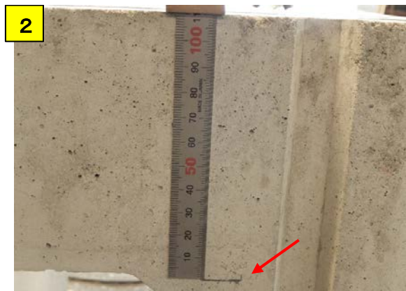
A固定・B固定・A移動・B移動の高さを側溝にマーキングする