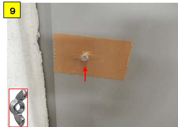
A移動の位置を確認し、A固定のボルトでガムテープを突き破る