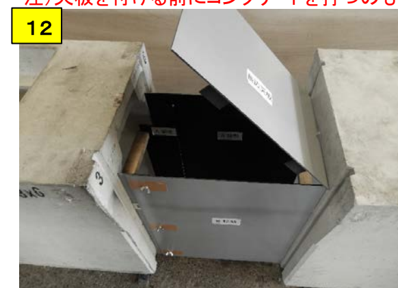
固定天板をズレ止めがA移動とB移動の内側に入るようにはめ込む