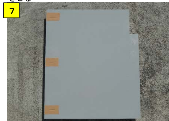
A移動とB移動の長穴をガムテープでマスキングする