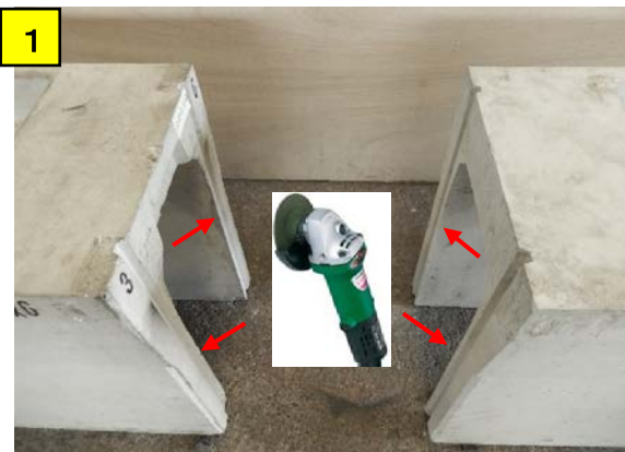
側溝の内側側面のコンクリートのバリをグラインダー等で完全にに取り除く