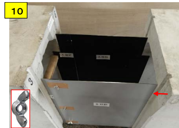
B移動の位置を確認し、A移動同様に蝶ナットで固定する