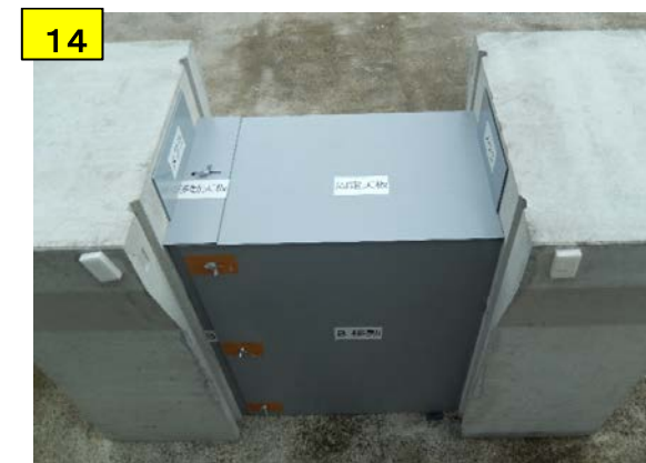
メスの部分はメクラでふさぎガムテープ等でマスキングする