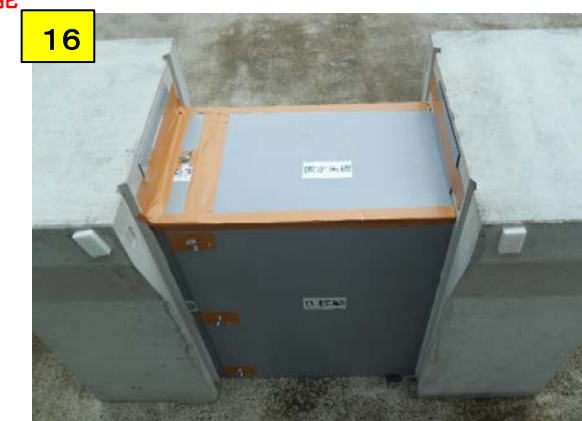
コンクリートが流入しないようにガムテープ等でしっかり養生する