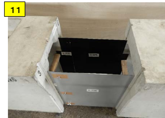
A固定・A移動・B固定・B移動の位置を確認後、バタ角でしっかり側溝と固定する 注)天板を付ける前にコンクリートを打つのも可能