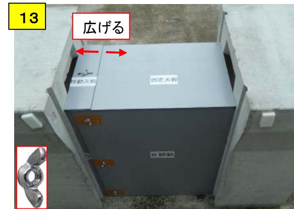
移動天板を固定天板のボルトに差し込み、側溝との隙間が無いように調整しトラスネジで固定する