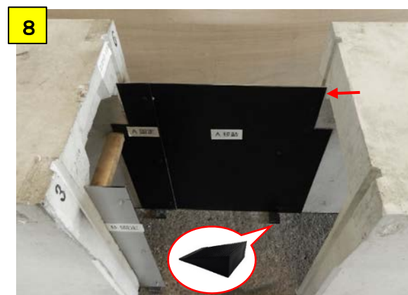
A移動をクサビで高さを調整し、側溝の隙間を無くしA固定に蝶ナットで固定する