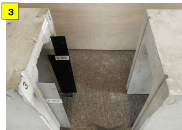
A固定とB固定を側溝に添える