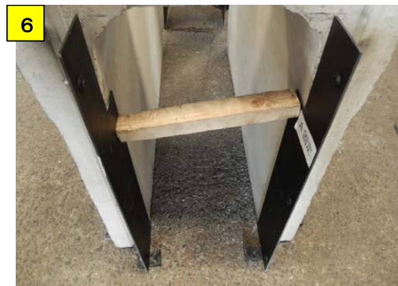
A固定とB固定の位置が決まったらバタ角でしっかり固定し、側溝とA固定・B固定を一体化させる